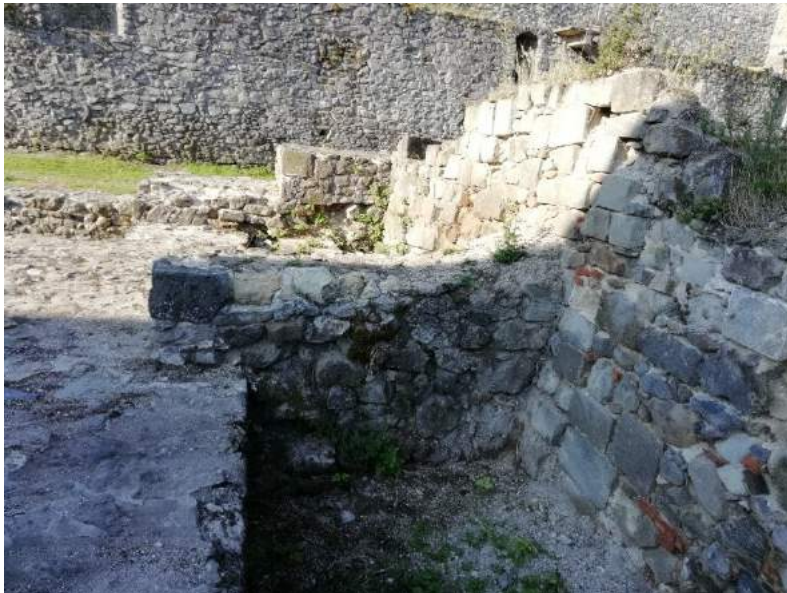
F121 ( Druhá strana steny )