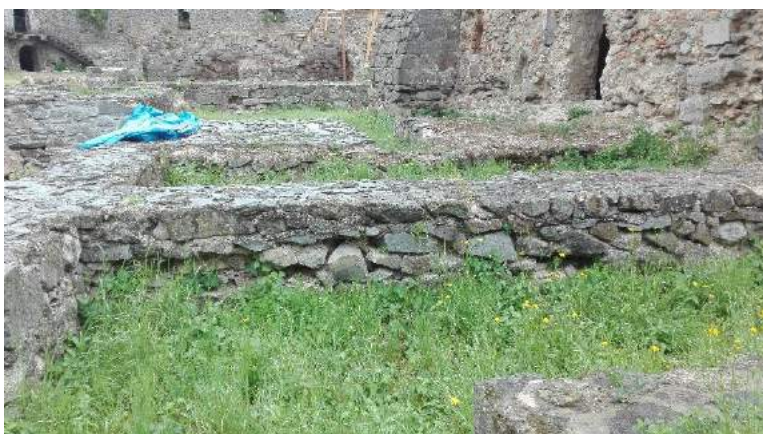
FM11 ( druhá strana múru)

Doplniť vypadnuté líce torzálneho múru a hĺbkovo preškárovať (F1,FM11,FM11druhá strana múru)